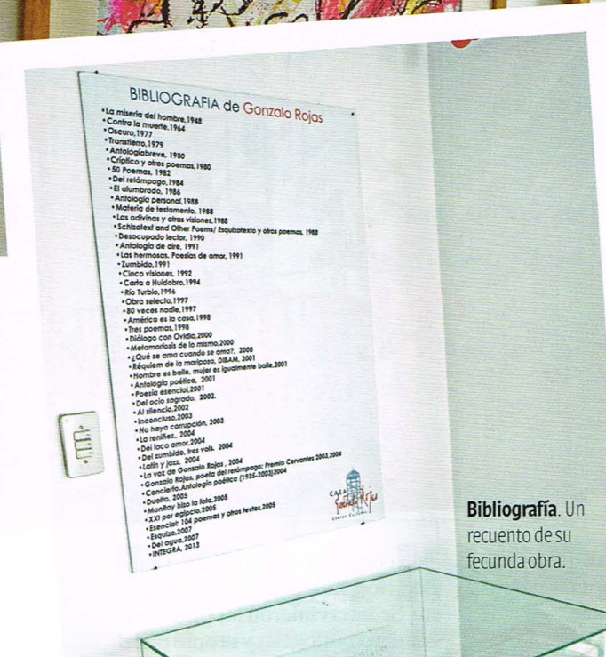
Bibliografía. Un recuento de su fecunda obra.