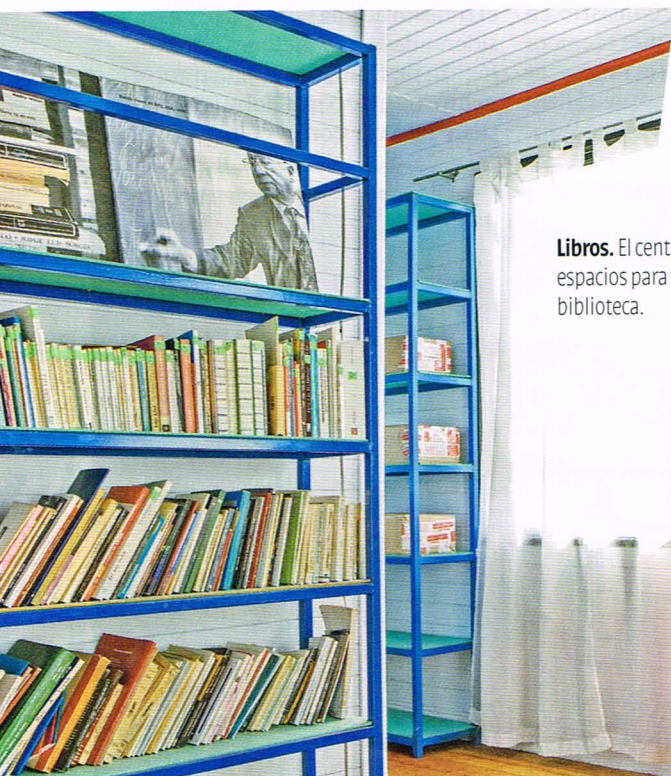
Libros. El centro considera diversos espacios para ser usados como biblioteca.

La tercera y última etapa, que está en ejecución, consiste en dejar operativa la casa como centro cultural, con sectores o zonas que sean útiles para literatos y visitas generales. Se está trabajando en el diseño del Mee-