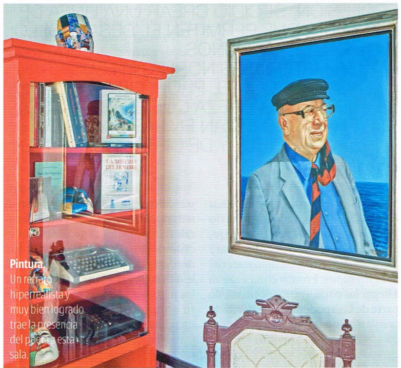
Pintura. Un retrato hiperrealista y muy bien logrado trae la presencia del poeta a esta sala.