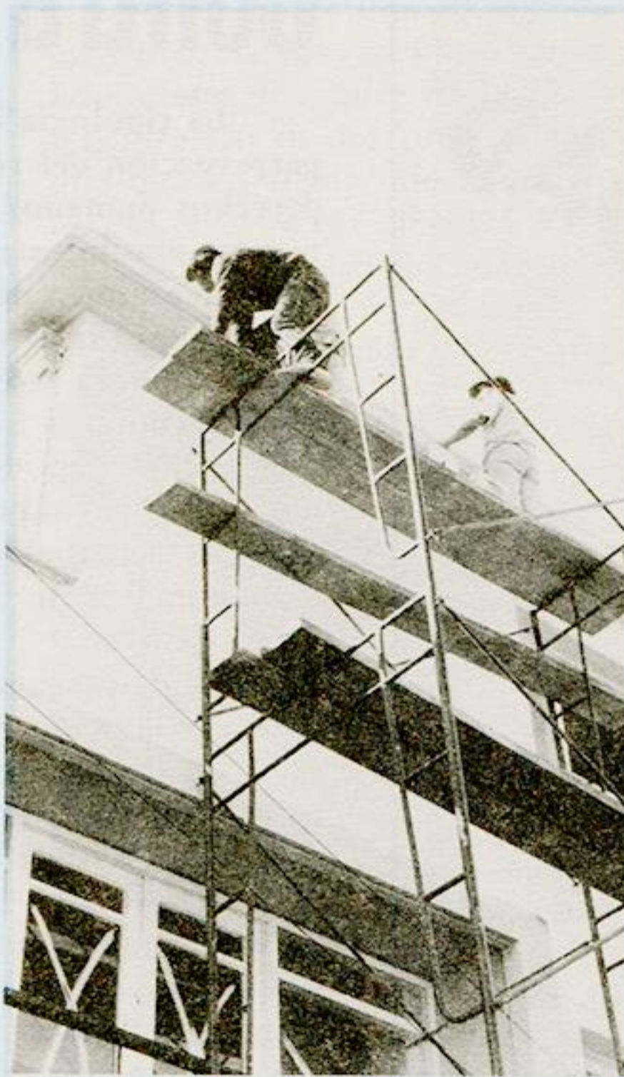
• Las actividades en altura, también son altamente inseguras.