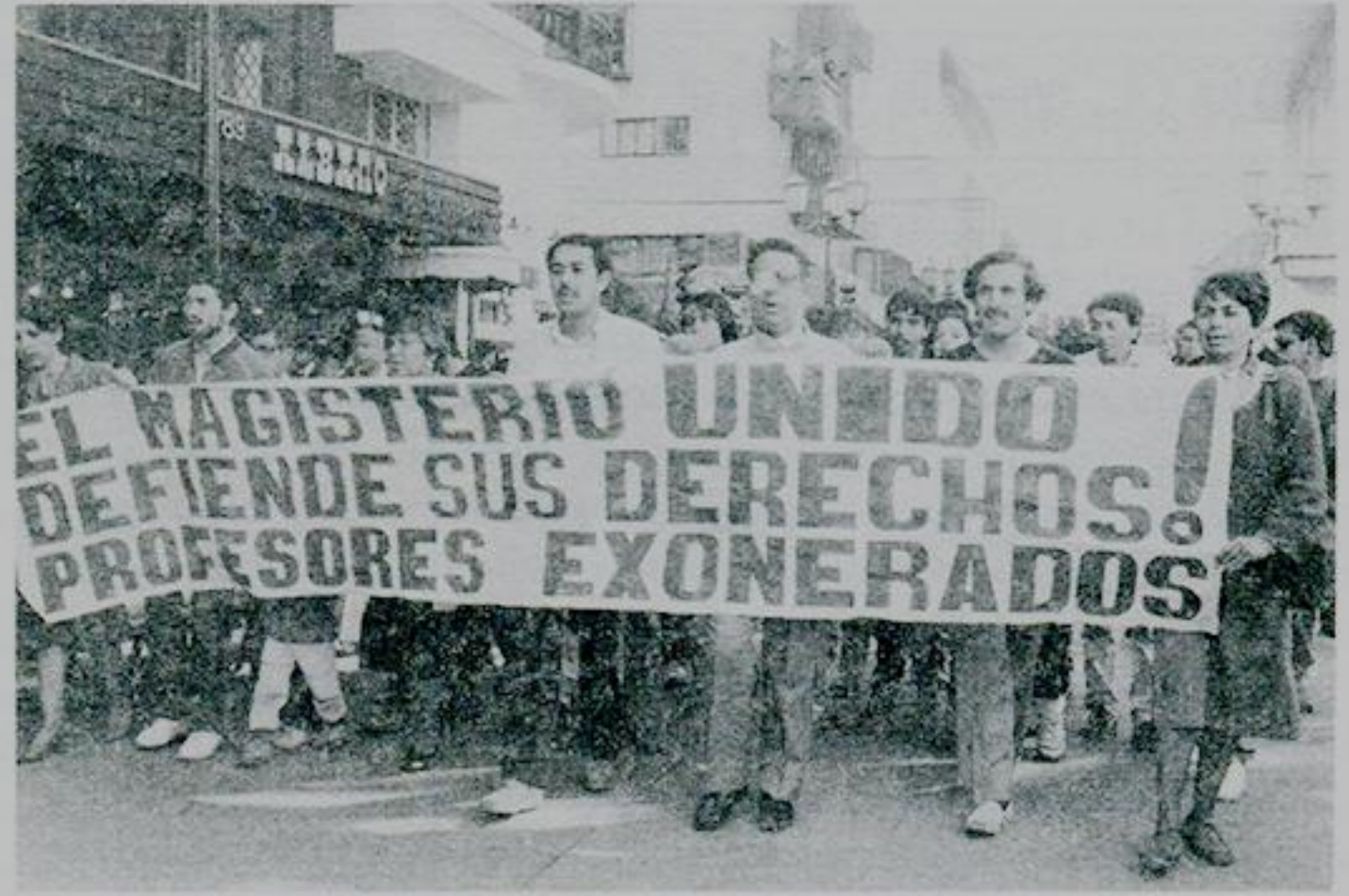
• La foto recuerda una de las tantas acciones de denuncia realizadas por los profesores exonerados de nuestra zona.

La solidaridad que han recibido en estos meses de cesantía ha sido importante y se traduce, más que nada, en donativos provenientes de distintos sectores luego de la motivación que hiciera el comité de exonerados. “Sin duda el aporte ha sido valioso, pero en muchos casos faltan los canales adecuados para generar un mayor apoyo”. También han tenido el apoyo de los estudiantes, sobre todo “en los cuatro meses que duró nuestra olla común, donde recibimos la ayuda concreta de organizaciones de Iglesia, de carácter social, sindical, de comerciantes y vendedores de la Vega, por eso no nos podemos quejar, pese a que los problemas de superviven-