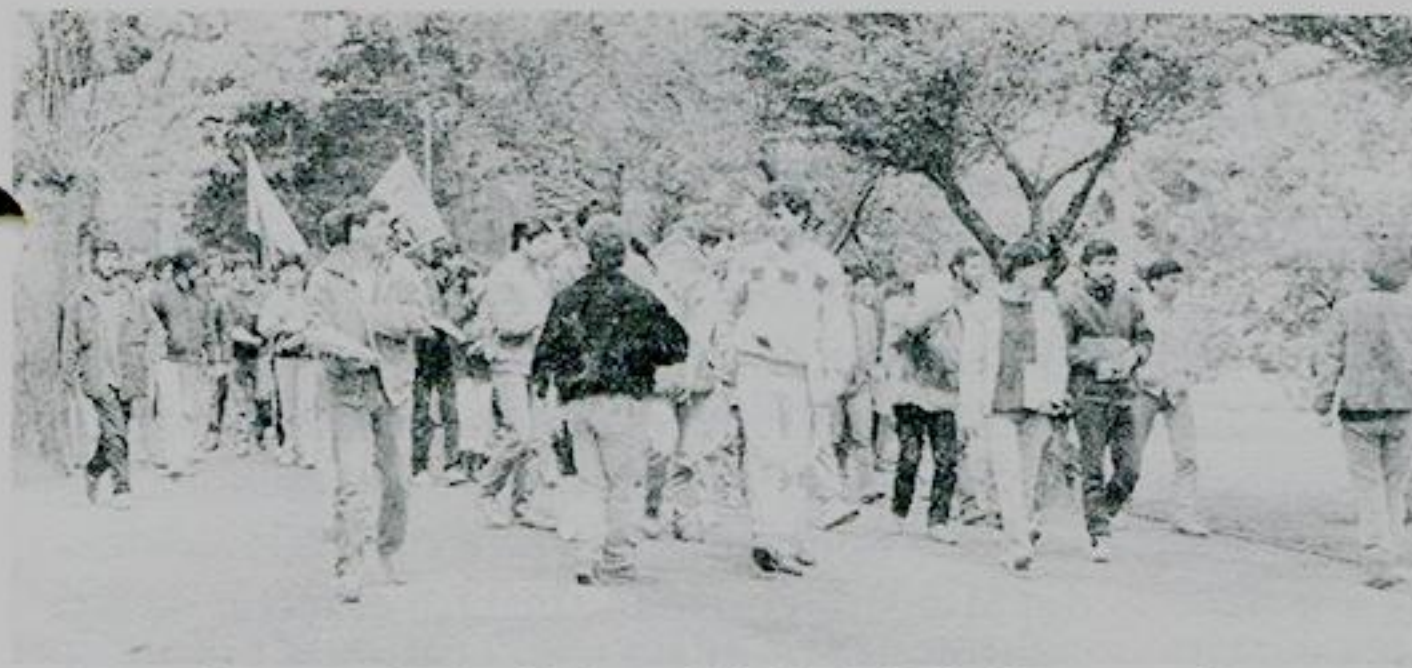
• Estudiantes de la Universidad del Biobío marchan hasta la rectoría para manifestar su descontento por la actitud de Víctor Lobos.

Por ello, los dirigentes de la Federación de Estudiantes solicitaron al rector Víctor Lobos Lápera un pronunciamiento sobre el asunto y lo invitaron a una asamblea masiva de estudiantes efectuada el 14 de octubre, en el gimnasio de esa universidad. Sin embargo, la autoridad no concurrió a la cita, “dejando, como en la mayoría de las ocasiones anteriores, sin