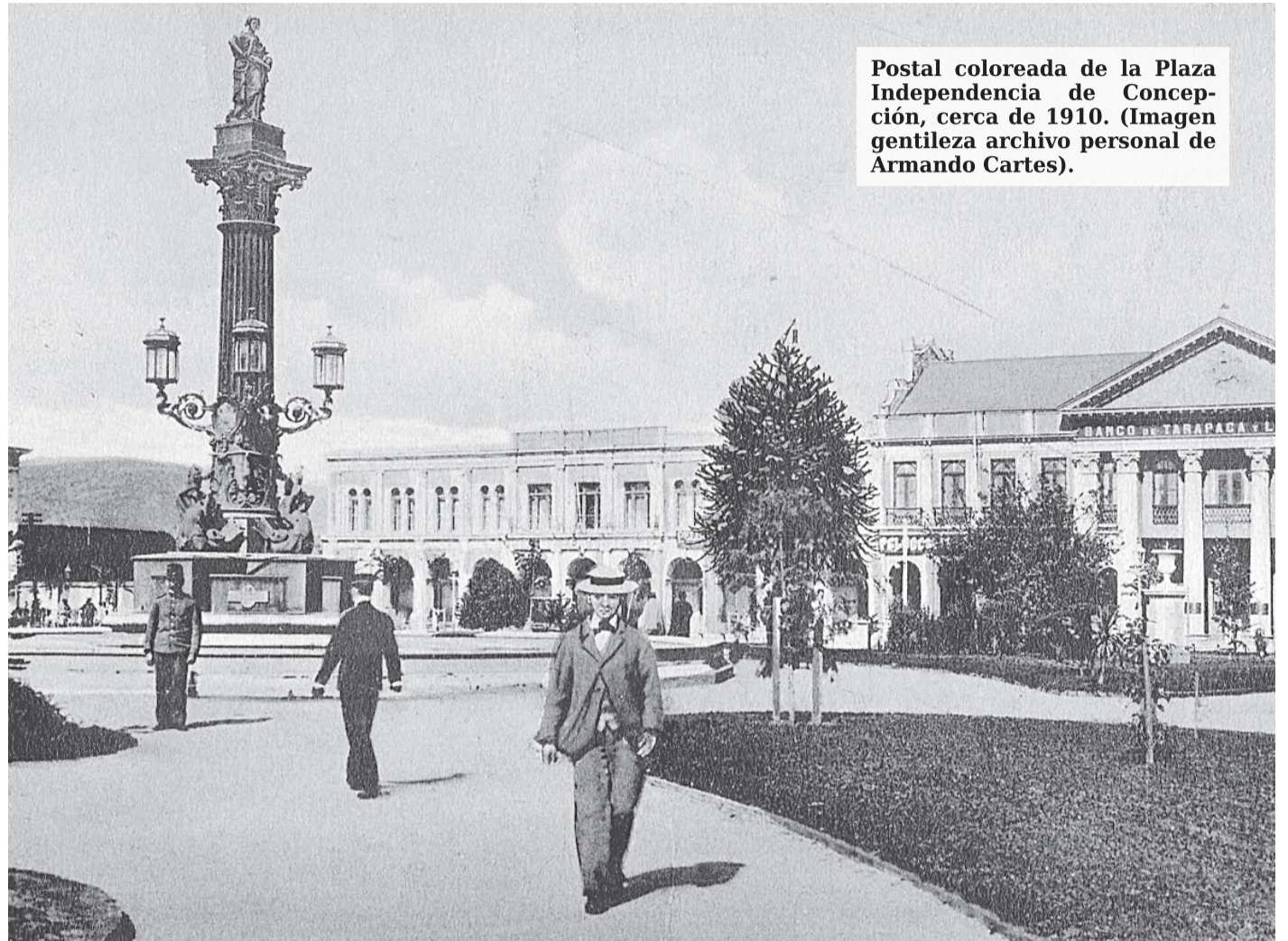
Postal coloreada de la Plaza Independencia de Concepción, cerca de 1910.

“No tengo ningún inconveniente en reconocer el tremendo gesto de Talca de ser el lugar donde se firmó y se juró el acta, y que bueno que lo celebren y ojalá sea feriado. Pero no hay que ‘pasarse películas’. Los clubes revolucionarios donde se gestó la independencia fueron los de los Prieto y Serrano, en Concepción, en alianza con los Larraín santiagoños; en el resto del país solo se aspiraba a una tibia autonomía. En el sur fueron casi todas las batallas, salvo Chacabuco, Rancagua y Maipú; es la tierra de O'Higgins, de Rozas y también de grandes líderes realistas. Lo he explicado en varios libros.