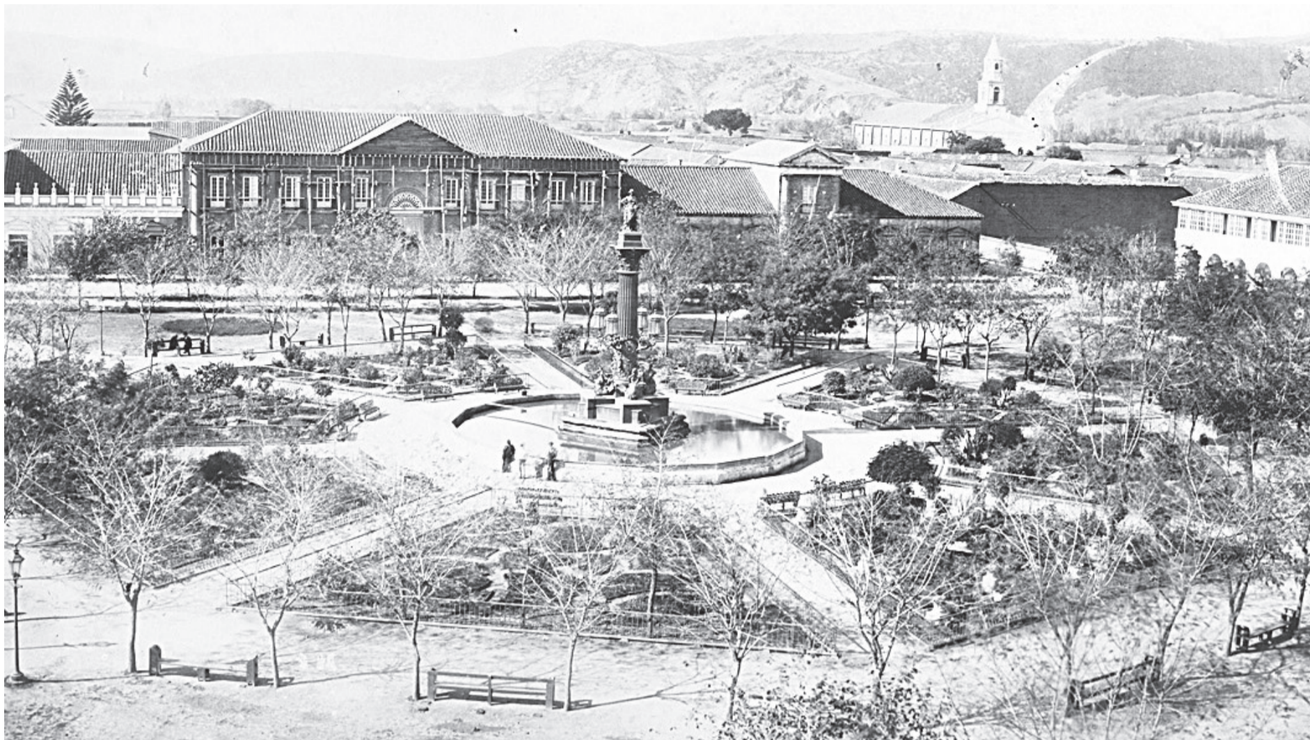
La "Plaza de la Independencia" de Concepción en 1879. (Fotografía gentileza archivo personal Armando Cartes).

El día martes 12 de enero pasado la comisión histórica de Concepción salvaguardó en el Congreso Nacional sus intereses sobre si en esa ciudad se declaró o no la independencia, cuya posición se basa en múltiples fuentes. La más obvia es la propia afirmación de Bernardo O'Higgins en el documento, donde deja constancia de que se declaró en Concepción, el 1º de enero, aunque luego se firmó en Talca una nueva acta formal, debido a que no tenía sentido repetir un gesto ya realizado. Desde ese día Chile ya era un Estado soberano y no una colonia y eso no podía desmentirse ni volverse a declarar, explican desde Concepción.