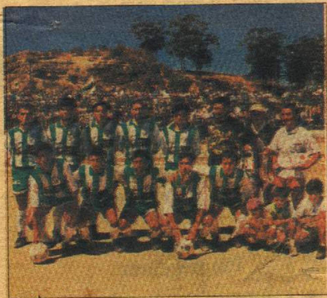
Industrial comienza a pisar fuerte en la Recopa.